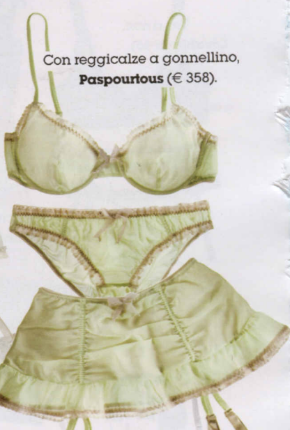
Con reggicalze a gonnellino, Paspourous (€ 358).