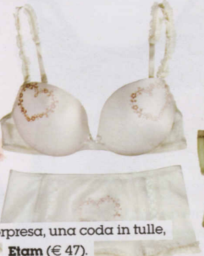
A sorpresa, una coda in tulle, Etam (€ 47).