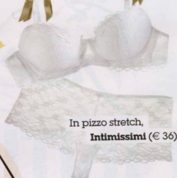
In pizzo stretch, Intimissimi (€ 36).