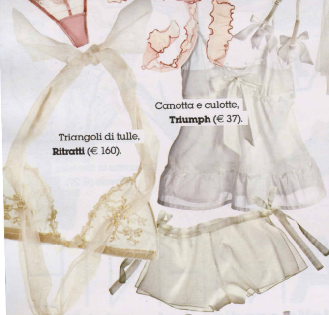
Canotta e culotte, Triumph (€ 37).