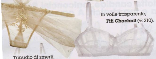
In voile trasparente, Fifi Chachnill (€ 210).