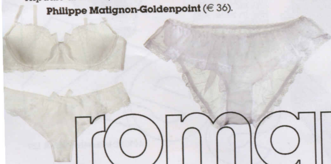
Tripudio di smerli, Philippe Matignon-Goldenpoint (€ 36).