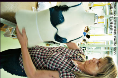
Size Cup 設計在香港的 Private Shop