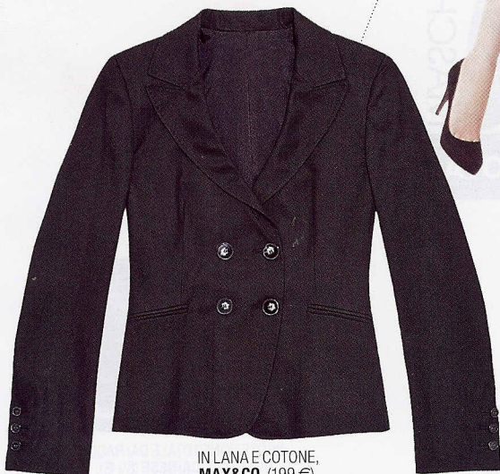
IN LANA E COTONE, MAX&CO. (199 €).