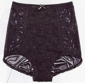
MODELLANTI, CON INSERTO DI PIZZO, INTIMISSIMI (20 €).