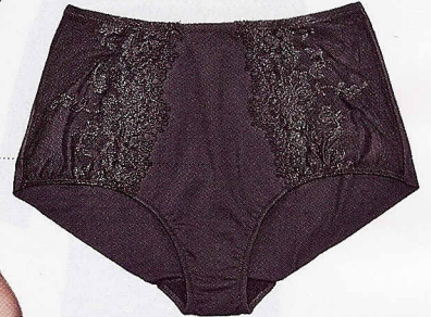
CON DETTAGLI DI TULLE RICAMATO, RITRATTI (79 €).