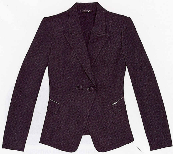
IN LANA CON PROFILI DI RASO, LIU JO (239 €).