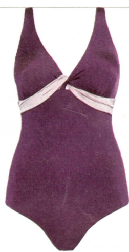
Incrocio magico per scollo d'effetto . Calzedonia (€ 59,50; 045-86.04.11).