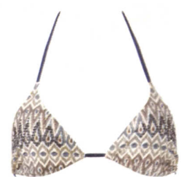
Zig zag etnico e laccetti a contrasto. Golden Point (€ 19,90; tel. 0376-94.12.11).