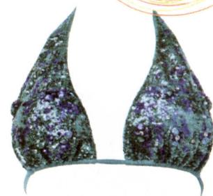
Per pavoneggiarsi e sfavillare in spiaggia. Emamò (€ 235; tel. 0732-25.09.54).