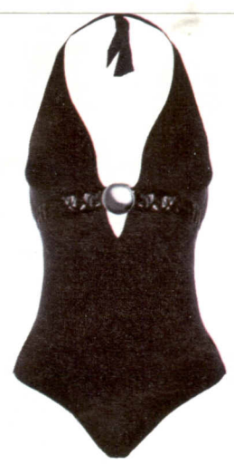
Seduazione anni '70 . Parah Noir Mare (€ 279; tel. 0331-70.42.00).