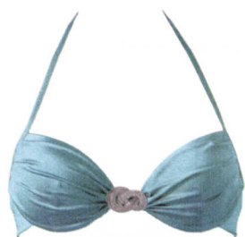
Un fermaglio gioiello divide le coppe. Golden Point (reggiseno € 29,90, slip