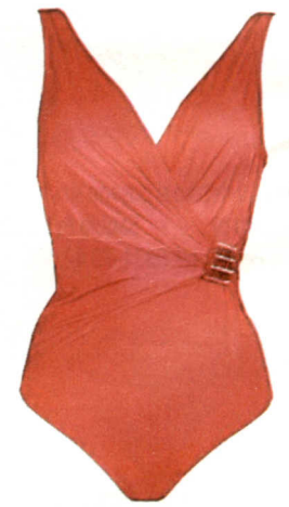
Drappeggio per chi si sente diva . Ritratti (€ 220; tel. 031-33.51.111).