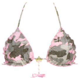
Per soldatessa «in rosa». Calzedonia (triangolo € 19,50, slip € 10; tel. 045-86.04.11).