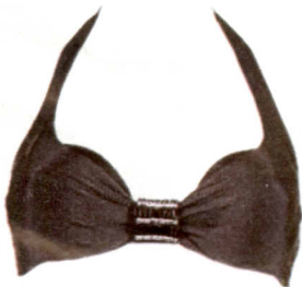
Sta bene a tutte le due pezzi color cacao, con fibbia etnica. Ritratti (€ 185; tel. 031-33.51.111).