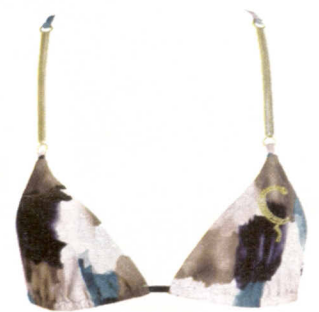
Délavé la fantasia del bikini giungla. Les Macons Danseurs (€ 147; www.lebonitas.it).