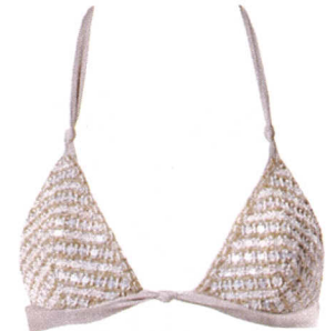
Raffinati bagliori lunari . La Perla Beachwear (€ 380; tel. 02-422.33.29).