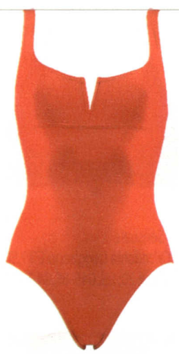
Scolpisce la figura l'intero di design . Eres (€ 285; tel. 02-72.08.06.60).