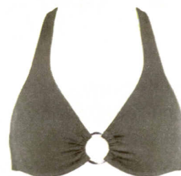
Mimetico neo hippie. Tezenis (slip € 9,90; reggiseno € 9,90; tel. 045-86.04.111).