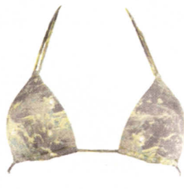
Per le più grintose, bikini con cartucciera sui fianchi. Pin Up Star (€ 162; tel. 051-62.57.071).