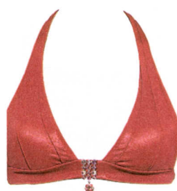
Sensuale effetto «bagnato» . Calzedonia (reggiseno € 39,50; slip € 20; tel. 045-86.04.111).