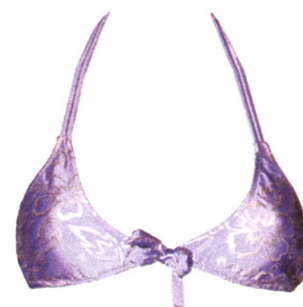
Corolle argentee su fondo cielo. Sundek (€ 54; per informazioni www.sundekusa.com ).