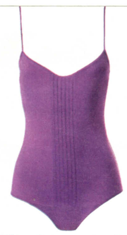
Esili bretelle a mostrare le spalle. Malizia (€ 121; tel. 02-42.23.329).