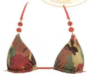
Effetto «ciliegia» sul camouflage. Calzedonia (€ 29,50 reggiseno, slip € 20; tel. 045-86.04.111).