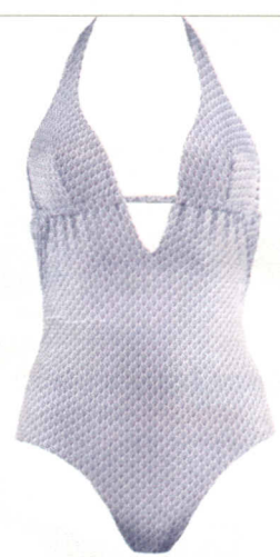
Microfantasia attira raggi. Pin Up Stars (€ 230; tel. 051-62.57.071).