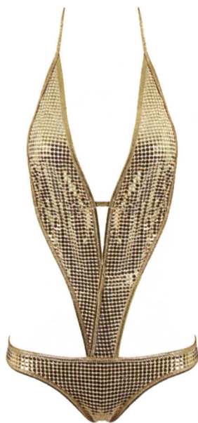
Esalta un fisico perfetto il trikini oro . Etam (€ 48; tel. 039-68.92.236).