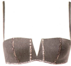
Ideale per le più formose, scolpisce il décolleté. Anna Club by la Perla (€ 198; tel. 02-42.23.329).