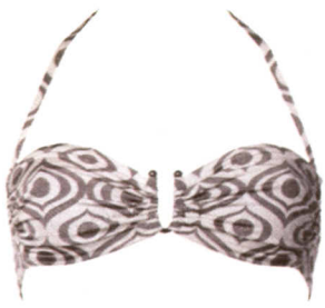
Tribale optical, con slip che valorizza i fianchi. Verdissima (€ 87; tel. 800-21.04.00).