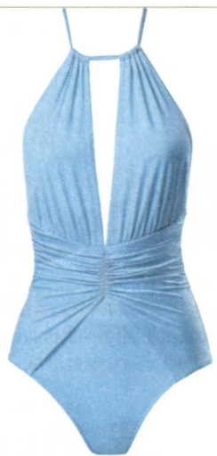
Sottolinea il vitino di vespa . Anna Club (€ 189; tel. 02-42.23.329).