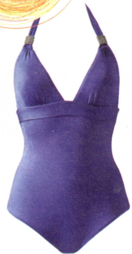
Taglio impero per maggiore : Golden Point (€ 39,90; tel. 0376-94.12.11).