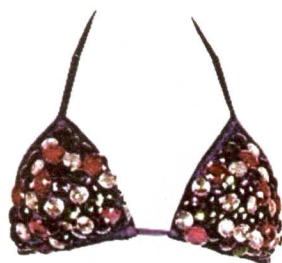
Elegante, il reggiseno è decorato come un top da sera. Swan (€ 145; 031-33.51.111).