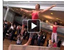
Fashion meets sport