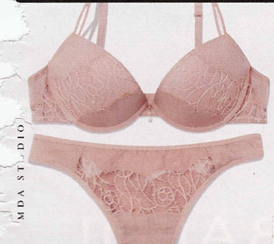
Charmeuse e pizzo, Luna (€75).