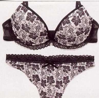
In microfibra, Swan Original (€81).