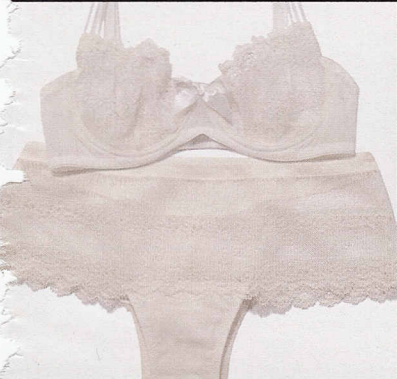
In pizzo Chantilly, Christies (€141).