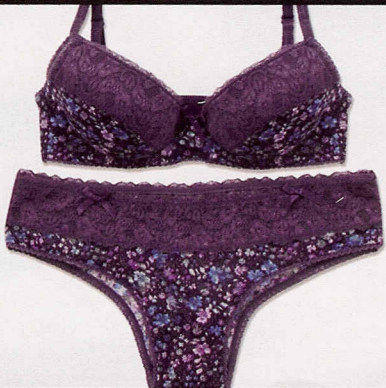
In tulle, Undercolors of Benetton (€37,80).