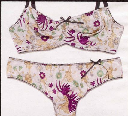
Con Lycra, Roberto Cavalli Underwear (€164).