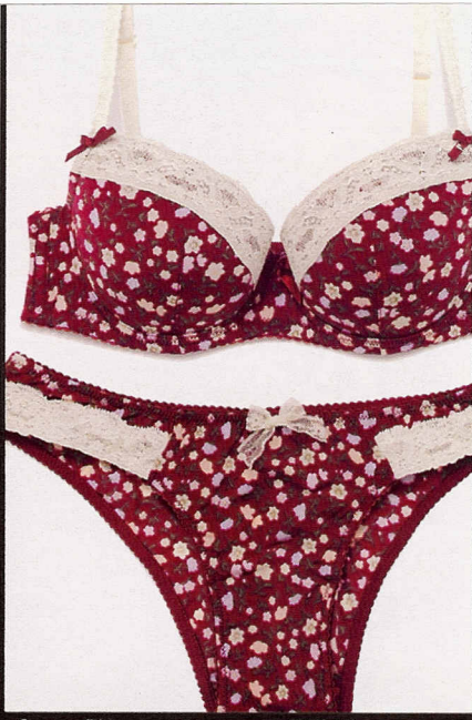
Con profili in pizzo, Yamamay (€35,80).