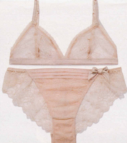
In raso e pizzo antico, Etam (€35).