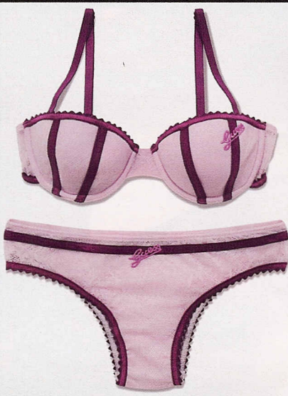
Con profili in seta, Guess Underwear (€63).