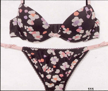
Inserti in raso, Blugirl Underwear (€145).