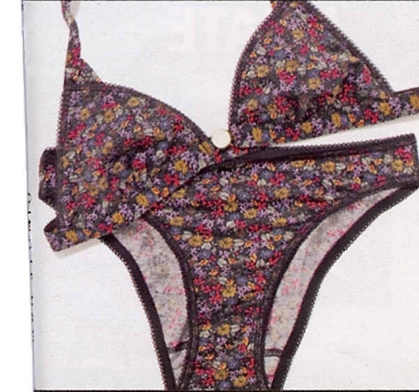
In cotone, Petit Bateau (€31,90).