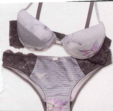
Con pizzo, Emporio Armani Underwear (€87).