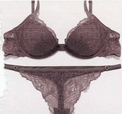
In pizzo, Calvin Klein Underwear.