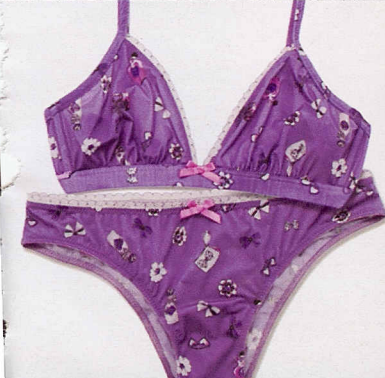
Con ruches in tulle, Tezenis (€15,80).

PEONIE E MARGHERITE APPENA SBOCCIATE, COLORI RUBATI AL SOTTOBOSCO E UN TRIPUDIO DI MERLETTI . L'INTIMO SVELA IL SUO VOLTO HIPPIE, MA SEMPRE IPERFEMMINILE.