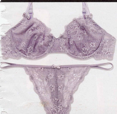
In pizzo stretch, Parah Online (€55).

NUANCE CON EFFETTO MAKE-UP E PIZZI LEGGERRISSIMI. PER COORDINATI DEDICATI A ETERNE PRINCESSE.