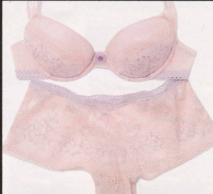
Dettagli in rete stretch, Lovable (€45,89).