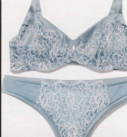
Pizzo, raso e tulle, Verde Veronica (€119).