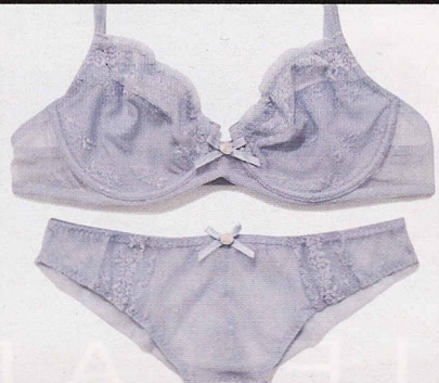
Tulle e pizzo, SiSi-goldenpoint (€23).