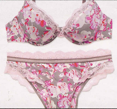
Con volant, Calvin Klein Underwear.