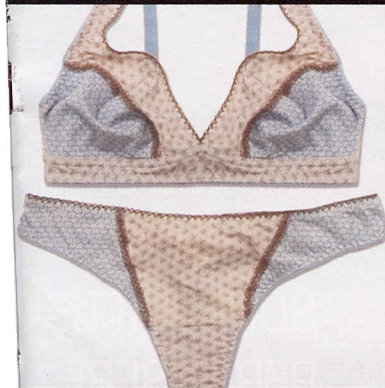
Effetto patchwork, Verdissima (€64).